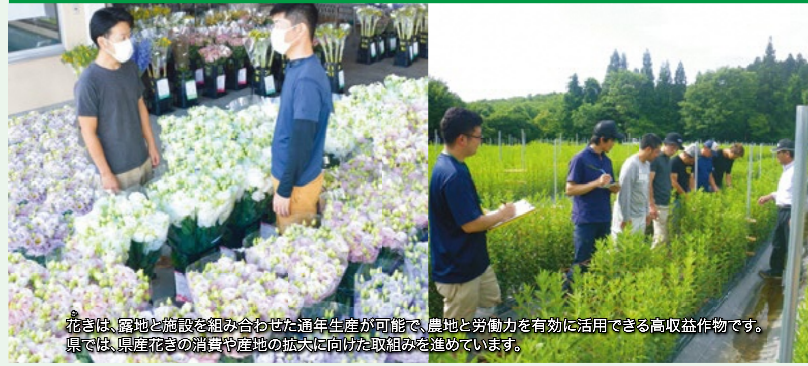
花きは、露地と施設を組み合わせた通年生産が可能で、農地と労働力を有効に活用できる高収益作物です。県では、県産花きの消費や産地の拡大に向けた取り組みを進めています。