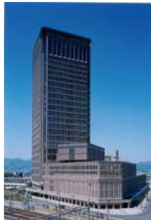
山形駅西口駐車場（霞城セントラル）