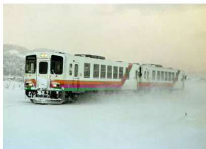
山形鉄道（フラワー長井線）