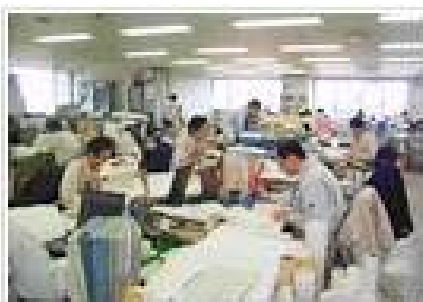
各種事業計画立案支援