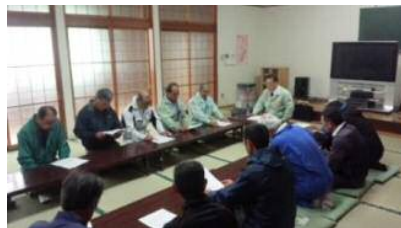
分収割合見直しに向けた地元への説明会