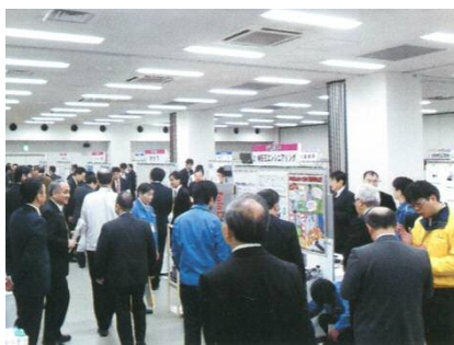
展示会（機械要素技術展への出展）