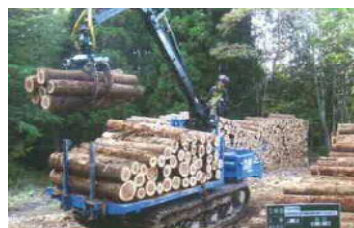
搬出間伐による収益の確保