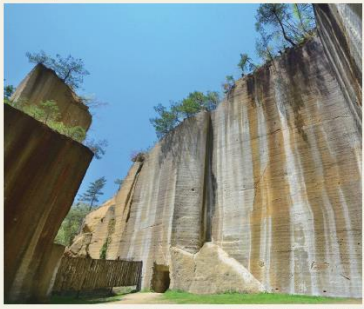
瓜割石庭公園について

撮影者のエピソード 高島町の道の駅からすぐのところにあるこの場所。昔は採掘場として栄えていた跡地を整備しており切り立った石の壁が広がっています。そんなに広くは無いのでサクッと回れるのですがご覧の通り壮大な景色が見えます。ぜひ晴れた日にこのコントラストを見に行ってみてください!