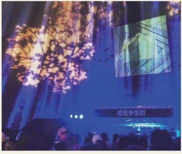
岩壁音楽祭について

撮影者のエピソード この写真は2019年5月25日に瓜割石庭公園で開催された岩壁音楽祭の写真です。瓜割石庭公園は、県外の観光客どころか置賜の人にも認知されていません。私は多くの人に実際に足を運んで、この高島石が造る「岩壁」の迫力を体験して欲しいです。また、置賜で生まれ育った1人の高校生として、このような形で地域づくりに貢献できて嬉しいです。