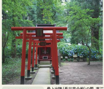
御楯稲荷神社について

撮影者のエピソード 直江兼統が戦勝祈願をしたお稲荷様らしい? 八乙女神社内の小さな祠です。周囲の紫陽花が見応えがあります。