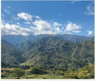
やまがた百名山「倉手山」とは

撮影者のエピソード 倉手山は低山ながらも、数多くの山野草が自生する「花の山」として根強い人気があるやまがた百名山です。この作品は樽口峠展望台からの眺めですが、背後に雄大な飯豊連峰を従え倉手山の威風堂々ぶりが伝わる作品になったと思います。