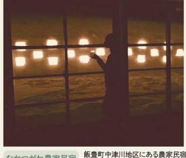
なかつがわ農家民宿について

撮影者のエピソード 寒く冷たい雪でも灯りをともしれば気持ちはあったかくなります。画像からそんなあったかい気持ちを感じてもらえれば幸いです。