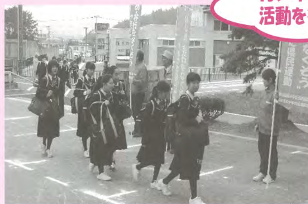
○「山形県少年の主張大会」の開催 ○「県民運動」の啓発活動の展開