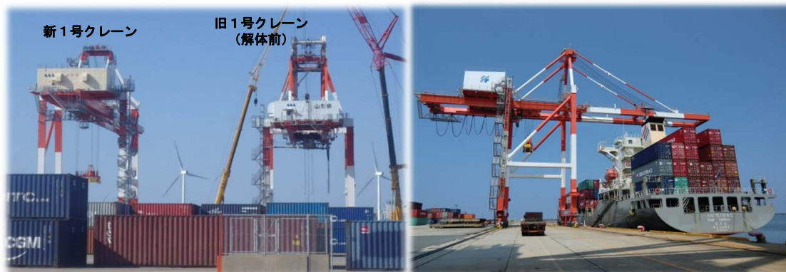
1号コンテナクレーン設置状況