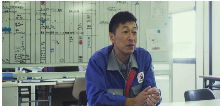
県外の大学に進学後、庄内にUターン (勤務先：株丸高)