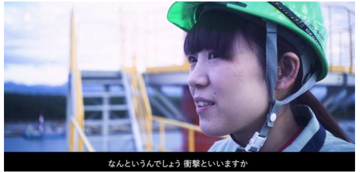
県外の大学に進学し、県外にて就職後、庄内にUターン (勤務先：サミット酒田パワー株)