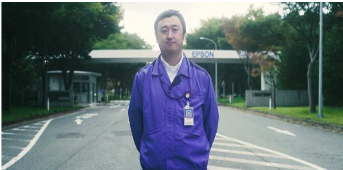
県外の大学に進学し、県外にて就職後、庄内にUターン (勤務先：東北エプソン株)