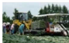
機械化体系の導入