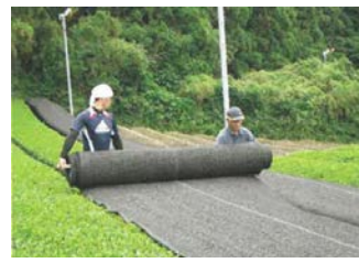
茶の被覆作業の実施