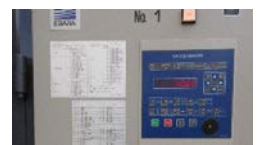
環境制御盤の導入