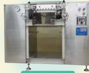
ドラムドライヤー