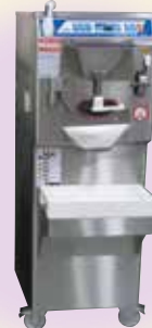
アイスクリーム製造機