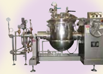
加圧減圧攪拌試験機