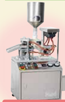
ライスケーキマシン