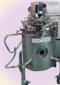
炭酸飲料製造装置