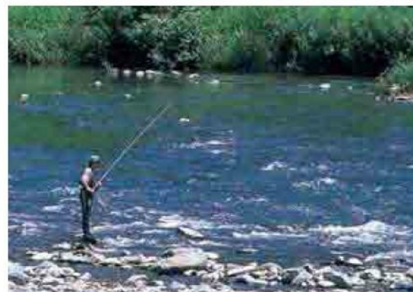
钓香鱼 最上川及其支流水质清澈，钓香鱼在山形作为一种普遍的娱乐方式而受到欢迎。 鮎釣り 最上川やその支流など清流が多い山形では一般的な娯楽として親しまれている。