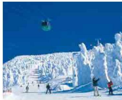
滑雪板・雪橇（山形市蔵王） 拥有很多富于变化的滑雪练习场，吸引了来自国内外的滑雪和雪橇爱好者。 スキー・スノーボード（山形市蔵王） パウダースノーで知られる変化に富んだゲレンデが多く、国内外からスキーヤーや、スノーボーダーが集まる。