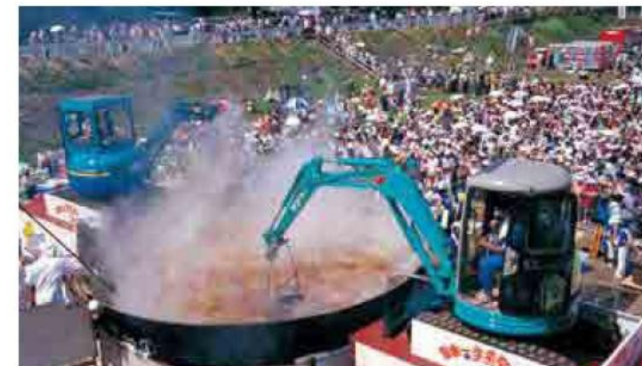
全日本最大の煮芋节（山形市） 秋的风景诗一般，颇具特色的山形煮芋大会热闹非凡。以使用全日本最大的锅为特色。 日本一の芋煮会フェスティバル（山形市） 秋の風物詩、芋煮を野趣豊かにそして賑やかに味わおうと日本一の大鍋で豪快につくる。