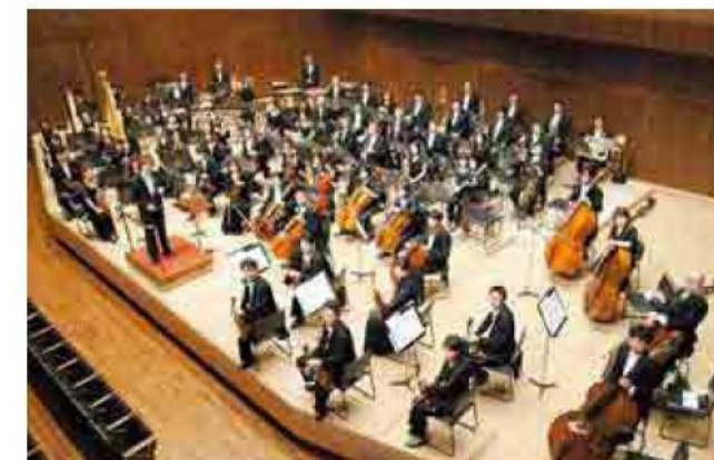
山形交响乐团 成立于1972年的专业管弦乐队，每年大约举行150场的演奏会。在山形的友好州城市——科罗拉多州的公演也取得了成功。 山形交响乐团 1972年に発足したプロオーケストラ。年間約150回の演奏活動を行っている。姉妹州であるコロラド州での公演実績もある。