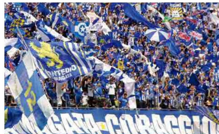
蒙特迪奥 山形 主场设在山形的职业足球队，球迷们给予了热烈的支持与加油。 モンテディオ山形 山形に本拠地を置くプロサッカーチーム。サポーター達が熱い声援を送る。