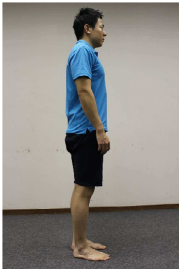
頭・肩・腰・足が直線