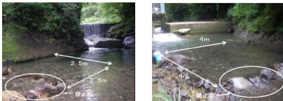
図3 完成した人工産卵場 (左: 芋川 右: 早田川)