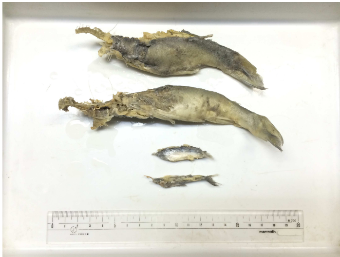
図1. カワウの胃から摘出したアユ（上：2尾）および同定不可能な小型魚（下：2尾）スケールは20 cm