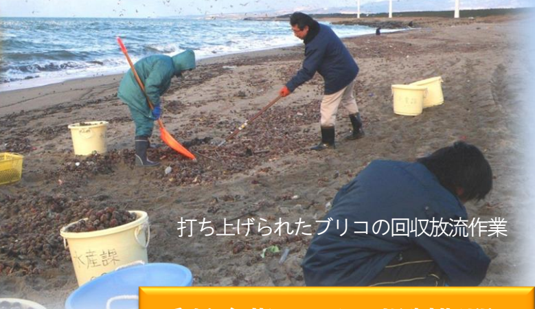
打ち上げられたブリコの回収放流作業