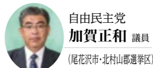
自由民主党 加賀正和 議員 (尾花沢市・北村山郡選挙区)