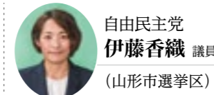
自由民主党 伊藤香織 議員 (山形市選挙区)