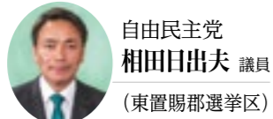
自由民主党 相田日出夫 議員 (東置賜郡選挙区)