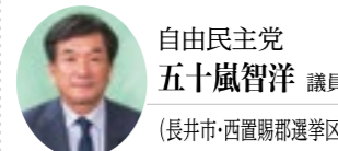
自由民主党 五十嵐智洋 議員 (長井市・西置賜郡選挙区)