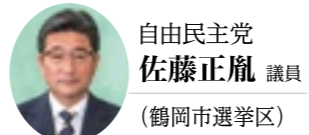
自由民主党 佐藤正胤 議員 (鶴岡市選挙区)