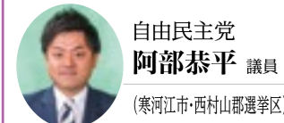
自由民主党 阿部恭平 議員 (寒河江市・西村山郡選挙区)