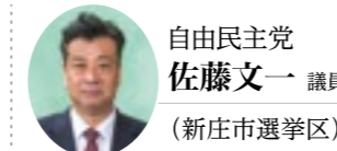
自由民主党 佐藤文一 議員 (新庄市選挙区)