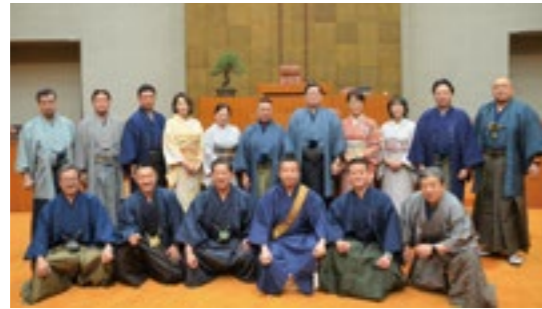
着物姿で本県の伝統産業をPR

今定例会では、2026年に行くべき世界の旅行先25選を契機とした今後のインバウンド振興や、県の結婚支援に関する現状と今後の取組みなど幅広い分野で活発な質疑質問が行われました。