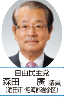
自由民主党 森田 廣 議員 (酒田市・飽海郡選挙区)

北1位、全国6位となっている。今後とも、トップセールスや「食と観光」を一体化したPRなど、効果的なプロモーションを実施し、国際的な認知度向上とブランドの定着を図っていく。