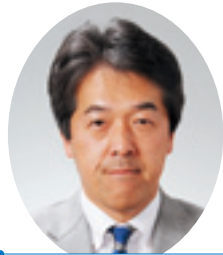
日本共産党山形県議団 関 徹 議員 (鶴岡市選挙区)

時間帯は常に運航できるように、体制を整えている。山岳地帯での活動には安全対策の徹底が不可欠であり、機体の定期点検・整備をはじめ、研修や実地飛行訓練等を行っている。今後とも、さらに安全性を確保するため、訓練を重ね、習熟を図っていく。