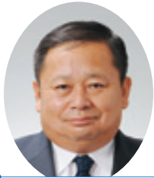
自由民主党 能登 淳一 議員 (村山市選挙区)

効果と懸念される課題を念頭に、東桜学館における取り組みや全国の先進校の状況、併設型中高一貫教育校に対するニーズの高まり、今後の生徒数の見通し、高校再編整備との関連、地域の要望等も踏まえ、設置地区や学校を検討していく。