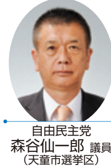
自由民主党 森谷仙一郎 議員 (天童市選挙区)