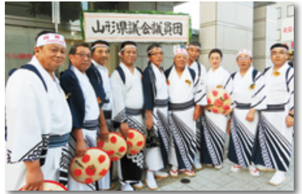
山形花笠まつりパレードに参加しました