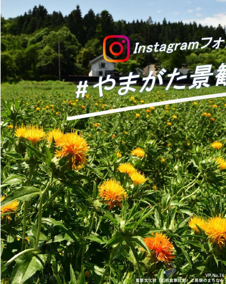
VP No.74 重要文化財「旧柏倉家住宅」と黒場のまちなみ