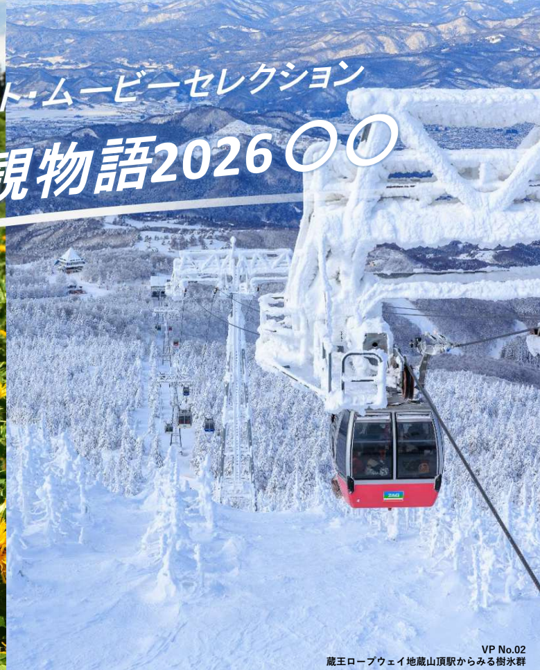
VP No.02 蔵王ロープウェイ地蔵山頂駅からみる樹氷群