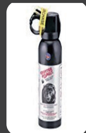
クマ撃退スプレー