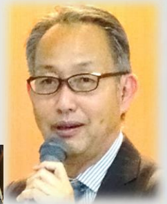
中野 澄 教授