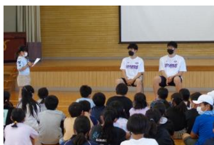
選手へのお礼の言葉で終了