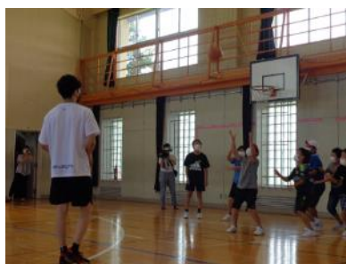
最後に児童とバスケットボール交流