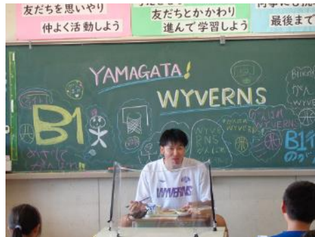
黒板に児童が書いた歓迎の言葉