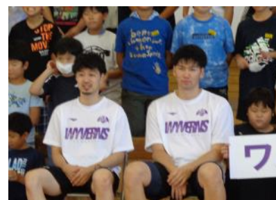
5・6年生も加わり、全員で記念撮影をしました。