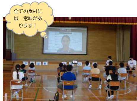
次に給食センターの栄養教諭より、オンラインで給食の食材に含まれている栄養やそのはたらきについてのお話がありました。