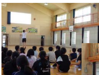
児童のリクエストによる選手のパフォーマンス披露（カッコイイね！）