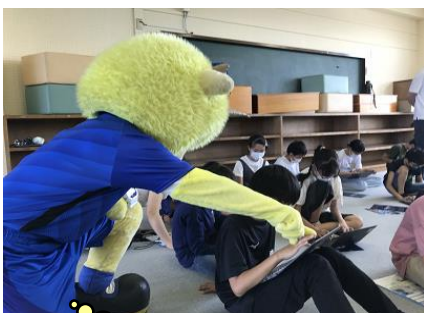
ディーオも一緒に考え中