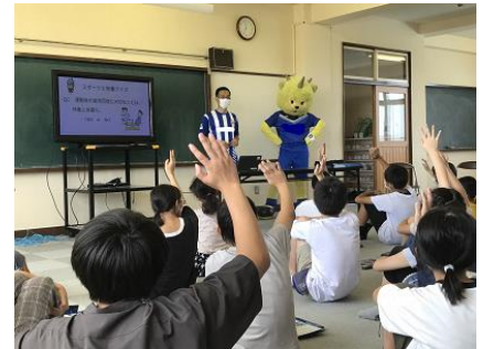
勉強したところでスポーツと栄養に関するクイズ！