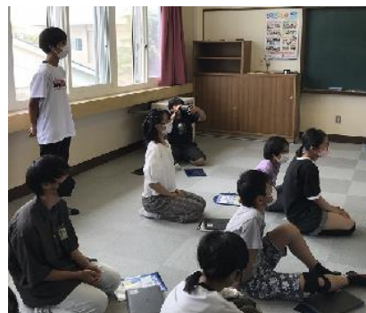
みんな一生懸命考えたメニューを発表！