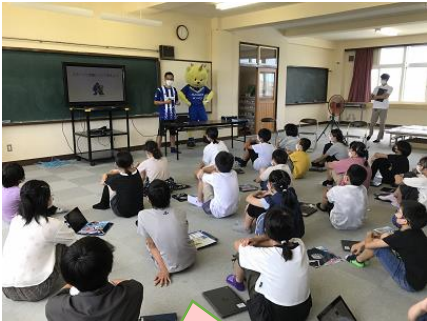
応援給食スタート！

令和4年7月13日に酒田市立琢成小学校において、モンテディオ山形応援給食が実施されました。6年生児童が、食べ物に含まれる栄養素の働きや、スポーツをしている人に大切な栄養について勉強し、一人一人がバランスの良い食事メニューについて考えました。また、モンテディオ山形スタッフから、身体は食べ物の栄養で作られていることや、スポーツ選手の食事についてのお話をお聞きし、身体作りには食事をバランスよくしっかりとることの大切さを、マスコットキャラクターの「ディーオ」と一緒に学びました。その実施の様子について、写真と一緒にご紹介します。