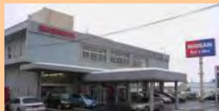
本社(千石町店)社屋