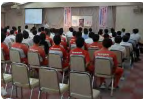
庄内保健所長による健康講話の様子

この取り組みや、健康講話などを通じて、社内での禁煙の雰囲気が高まり、従業員への禁煙の意識付けにもなっているとのことでした。