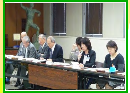
11月18日開催 健康づくり協議会の様子

その後、労働基準局・産業保健センターからの事業説明や健診機関や市町の取組み・課題について協議しました。