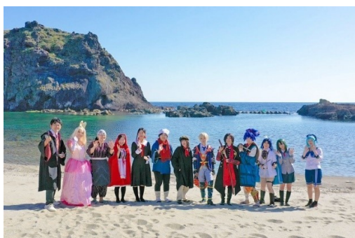
令和4年に開催されたコスプレイヤーの合宿イベント

この計画では、「安全・安心・安定・快適な環境の島」など4つの目標を掲げ、その達成に向け「島民の生活と観光を支える地域交通の充実」等、7つの政策を進めることとしています。