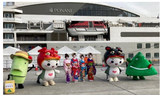
酒田舞娘、ゆるキャラなどによるふ頭でのおもてなし

4月、酒田港に外航クルーズ船が4回寄港しました。県では“プロスパーポートさかた”ポートセールス協議会などと連携して、古湊ふ頭で入港セレモニー、物産展、出港セレモニーを開催しました。延べ3千人以上の乗客が酒田港に訪れ、乗客やクルー、見学でいらした市民などで賑わったほか、オプションツアーなどで多くの方が庄内エリアの観光地を周遊しました。