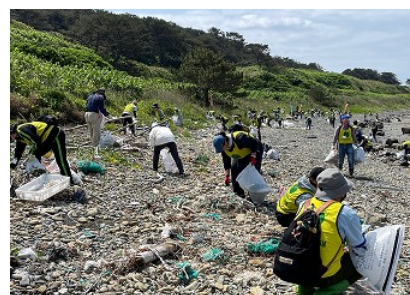
R5.5.27 飛島クリーンアップ作戦の様子