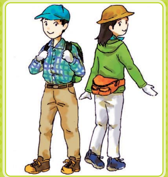
イラスト：金野やよいさん (小国町)