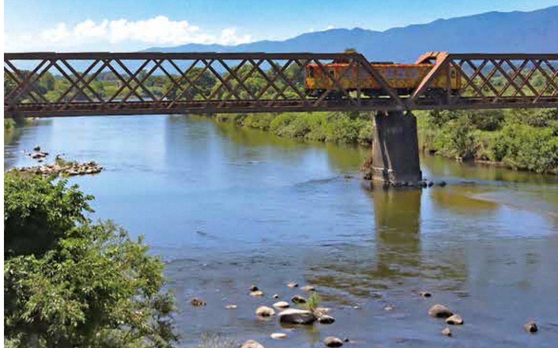
表紙「最上川と荒砥鉄橋、山形鉄道フラワー長井線」