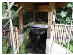
知恵の水 (利根水) (R1)