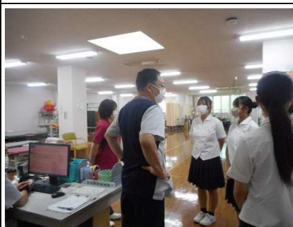
見学の様子② (リハビリテーション室)