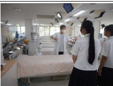
見学の様子③ (透析室)