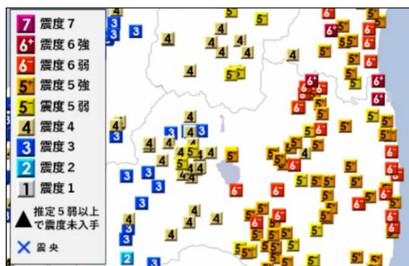
図1 震度分布