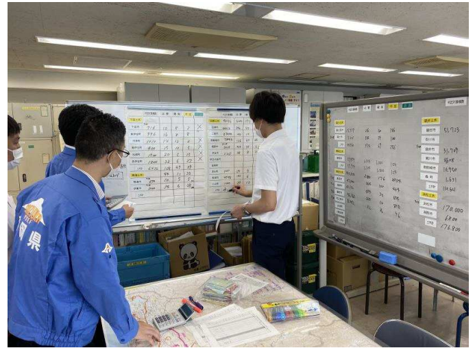
【写真：連絡訓練の様子】

また、被災県の直近の登録判定士数に対して約3%の判定士が活動可能と仮定し、地元だけでは不足する判定士数を、広域支援要請することとしました。