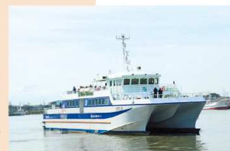
① 定期船とびしまフェリーターミナル