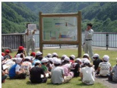
▲ダムの概要を説明