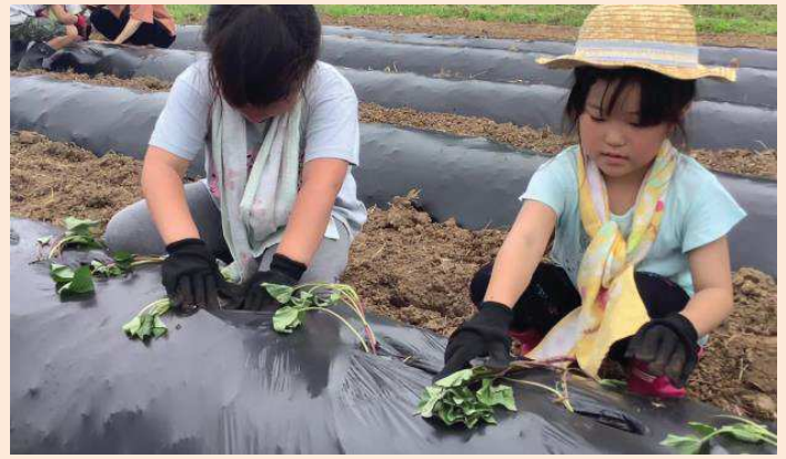
一生懸命苗を植えていきます