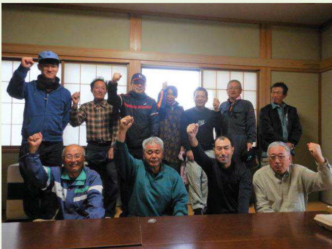
収穫祭に参加した月山ろく環境保全会の皆さん

秋を迎え、いよいよ待ちに待った収穫だ。里芋は夏の天候の影響で不作だった一方、今年のさつまいもは豊作。収穫後には庄内風芋煮のほか、掘りたてのさつまいもを使った焼き芋がふるまわれた。月山高原の秋を全身で味わえるイベントだ。