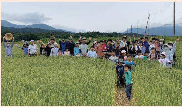
植え終わった後は小麦畑ではいチーズ！