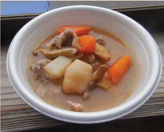
庄内風芋煮と採りたてのさつまいもの焼き芋

里芋の種いもと、さつまいもの苗の植えつけを体験できる。イベントでは植え付けが終わった後、月山高原にある小麦畑で記念撮影が行われた。月山高原の美しい夏の景色の中で楽しめるイベントだ。