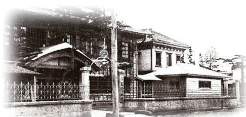
明治45年三友堂病院新館落成

をつなぐ重要な役割を果たす。また当院は平成17年5月に置賜地方では初となる緩和ケア病棟を開設した。現在もシームレスな緩和薬物療法を実践し、全人的苦痛からの解放に寄与している。