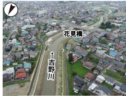
花見橋付近 (R3年8月撮影)