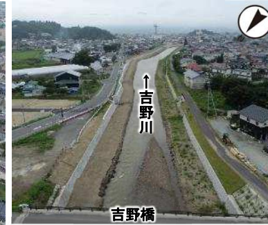
吉野橋下流付近 (R3年8月撮影)