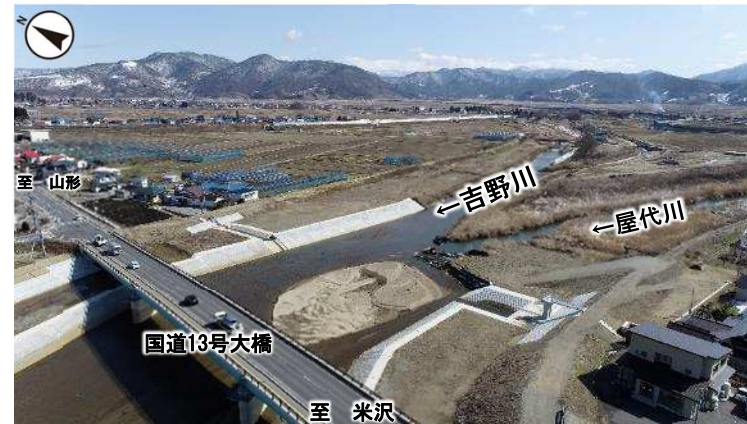
南陽市大橋付近 (令和6年3月撮影)