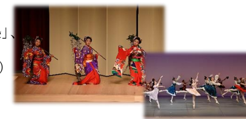
「こども郷土芸能芸術まつり」で子どもたちが日ごろの文化活動の成果を披露