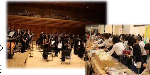
さくらんぼコンサート東京公演で山形の音楽と食をPR