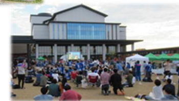
イベント会場では様々な催しが開かれ賑わいを見せている