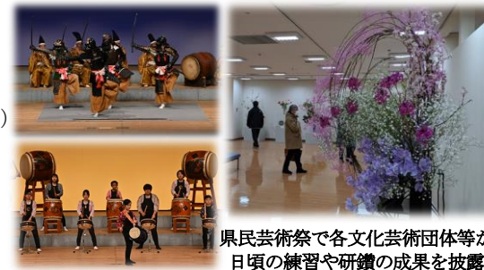
県民芸術祭で各文化芸術団体等が日頃の練習や研鑽の成果を披露