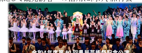
令和4年度第60回県民芸術祭記念公演