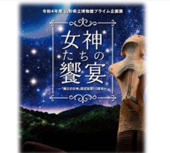
「縄文の女神」国宝指定10周年を記念したプライム企画展(令和4年)