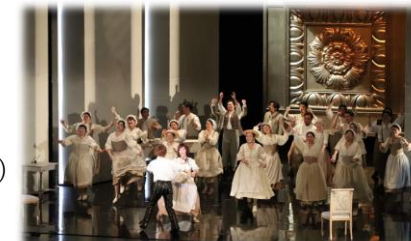
やまざん県民ホールで東京二期会によるオペラ『フィガロの結婚』公演 (R5.1)