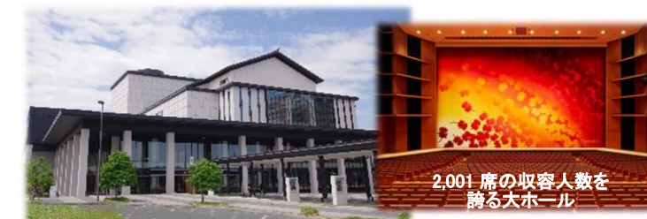
令和2年5月に開館した山形県総合文化芸術館