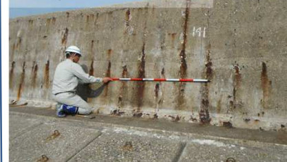
鉄筋露出状況【波返し部】