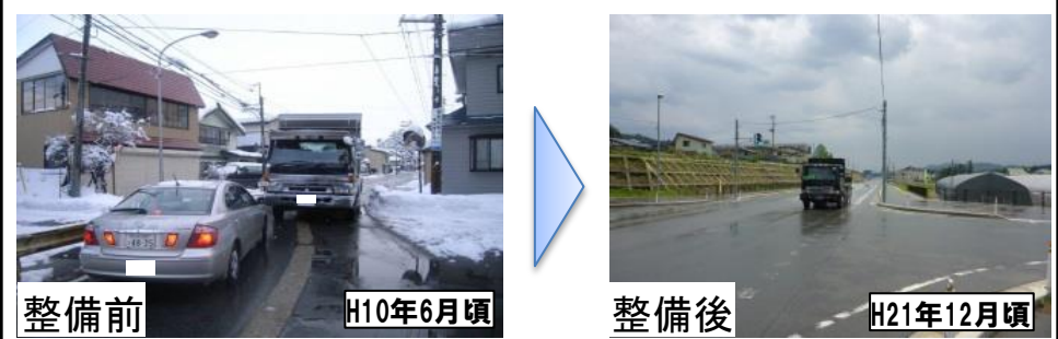
第 II 期区間の整備状況(市街地を迂回するバイパス整備)