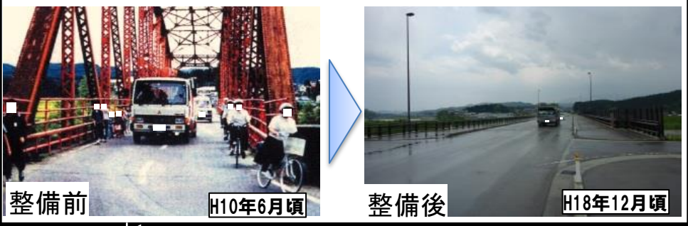
第 I 期区間の整備状況(大蔵橋の架替)