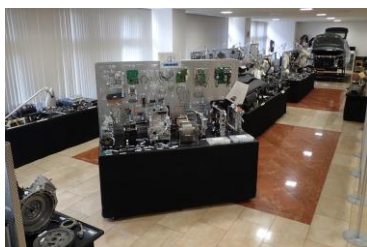
自動車部品ライブラリー

※団体見学の際は、事前にお電話にて、日時、人数等を、研修実施グループにお知らせください。