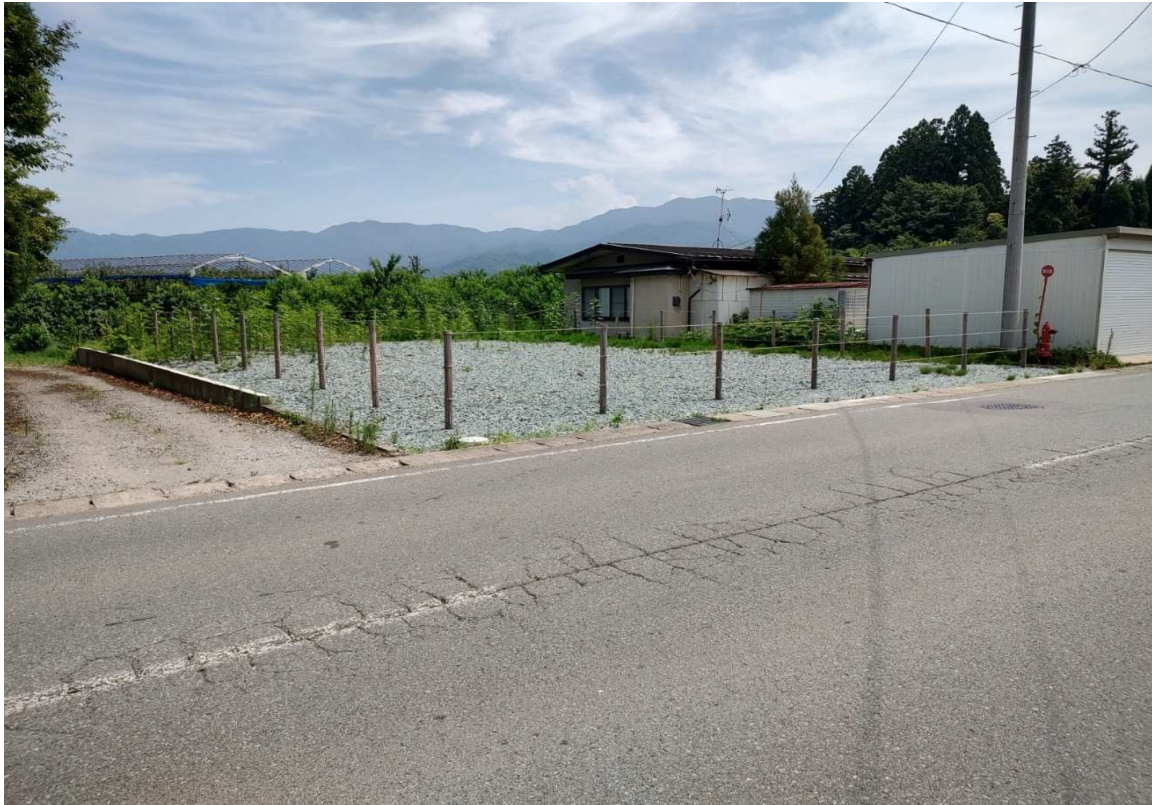
土地の北西側から南東方向を撮影