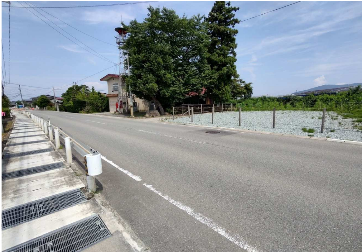
土地の南側より北方向を撮影