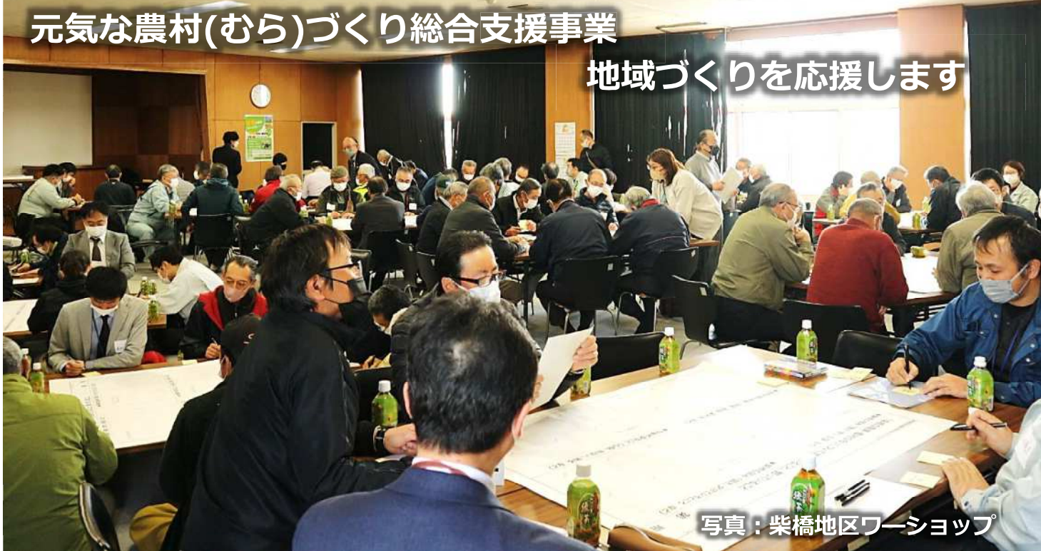
写真：柴橋地区ワークショップ