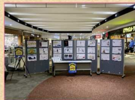
ショッピングモール (2021年)