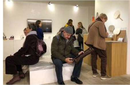
※昨年度の山形展の様子