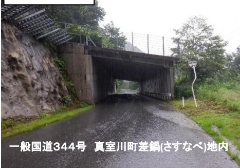
一般国道344号 真室川町差鍋(さすなべ)地内