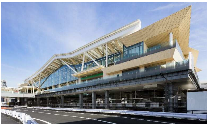
高輪ゲートウェイ駅外観