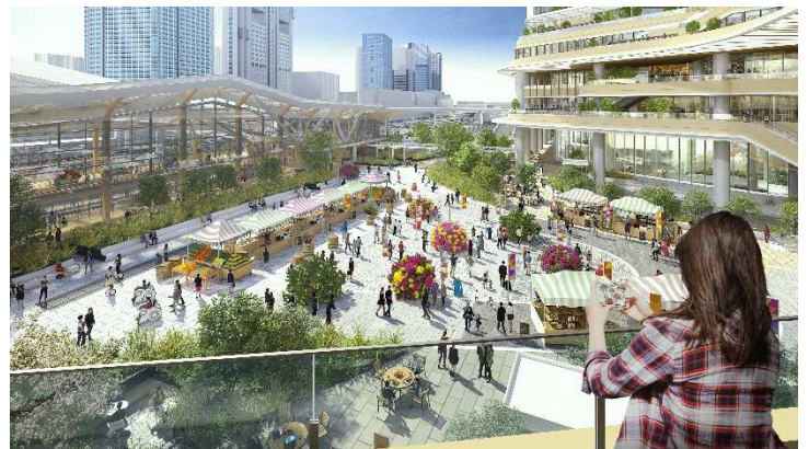
高輪ゲートウェイシティ(仮称) 催事イメージ

今回の TAKANAWA GATEWAY BEER FES.は JR 東日本と縁のある7社のクラフトビールブランドが出店します。特設会場では電車を見ながらご休憩いただけるほか、全国ローカル缶詰専門店「カンダフル」によるビールに合うおつまみもご用意しています。また、イベントとして、すいか割りを開催予定。この機会に強い甘みのある尾花沢すいかをご堪能ください。