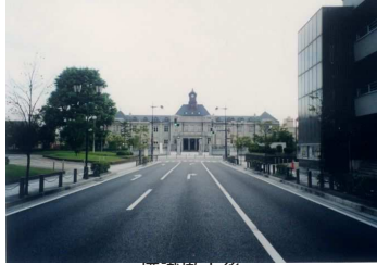
標識撤去後 (ひょうしきてつきよご)

← 視点場（してんば）と視対象（したいしょう）の間にある道路標識（どうろひょうしき）を撤去（てつきよ）した事例（じれい）