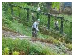
眺望景観資産第8号(H29.12.26指定) 楯山からの金山の街並みと月山・葉山の眺め(金山町金山) 「楯山を愛する会」の活動