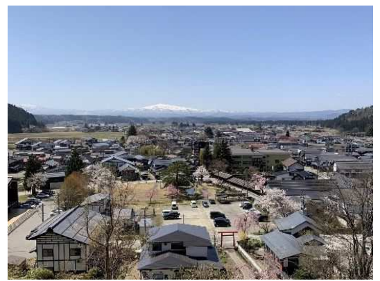
楯山からの金山の街並みと月山・葉山の眺め(金山町金山)