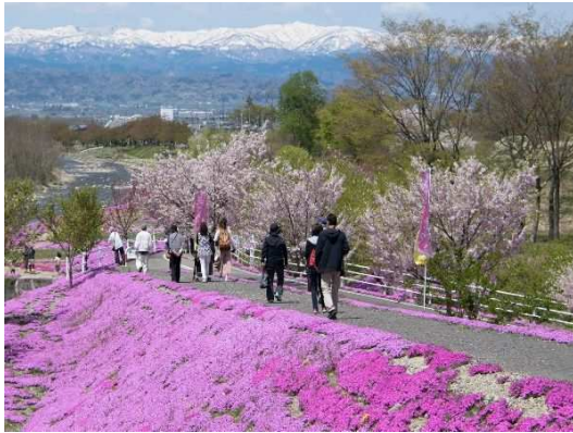
立谷川の芝桜(天童市荒谷～山形市大森の立谷川河川敷) 河川緑化ボランティアグループ「立谷川の花さかじいさん」の活動 第4回未来かがやくやまがた景観賞「山形県知事賞」(令和3年)

美しい景観は、ちいきの人の活動で守られています。みなさんの世代によりよい景観を引きついでいく取組みは、実は、みなさんの身近な場所でたくさん行われています。山形県では、このようなちいきづくり・まちづくりに取り組む活動を多くの人にお知らせし、地域活性化（ちいきかっせい）につながるようおうえんする活動をしていきます。