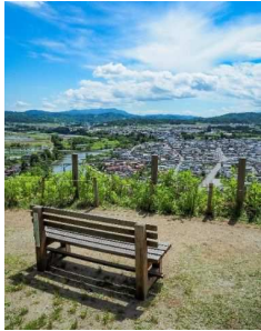
↑ 見ている場所がいごちよく、見やすい場所に整備された事例