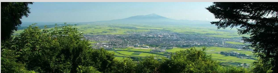
眺望景観資産第6号(H27.3.17指定) 大山公園～尾浦八景～からの自然と市街地と庄内平野をとりまく山々の眺め

将来の世代に引き継いでいくべきよいながめの場所を、「眺望景観資産」に指定しています。みなさんが大人になっても、良い景観のまま残るようにする制度です。