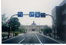
標識撤去前 (ひょうしきてつきよまえ)