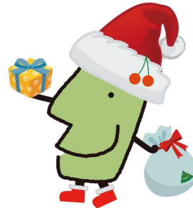
東根市 ひがしねウィンターフェスティバル