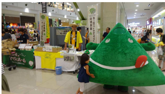
天童市 山形県産オーガニックマルシェ