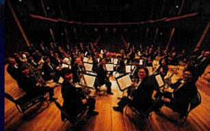
山形交響楽団 管弦楽