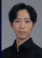
吉留 諒 ジークフリード王子