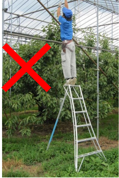
脚立の最上段は危険！