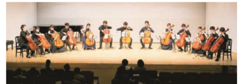
2019 ラストコンサート(エコーホール)

【プチコンサート】～上山市青少年による～ 4/30(日) 12:00 上山城 (要入館料)