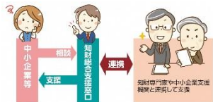
知財総合支援窓口の相談対応イメージ