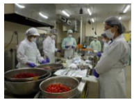
食品加工支援ラボでの研修