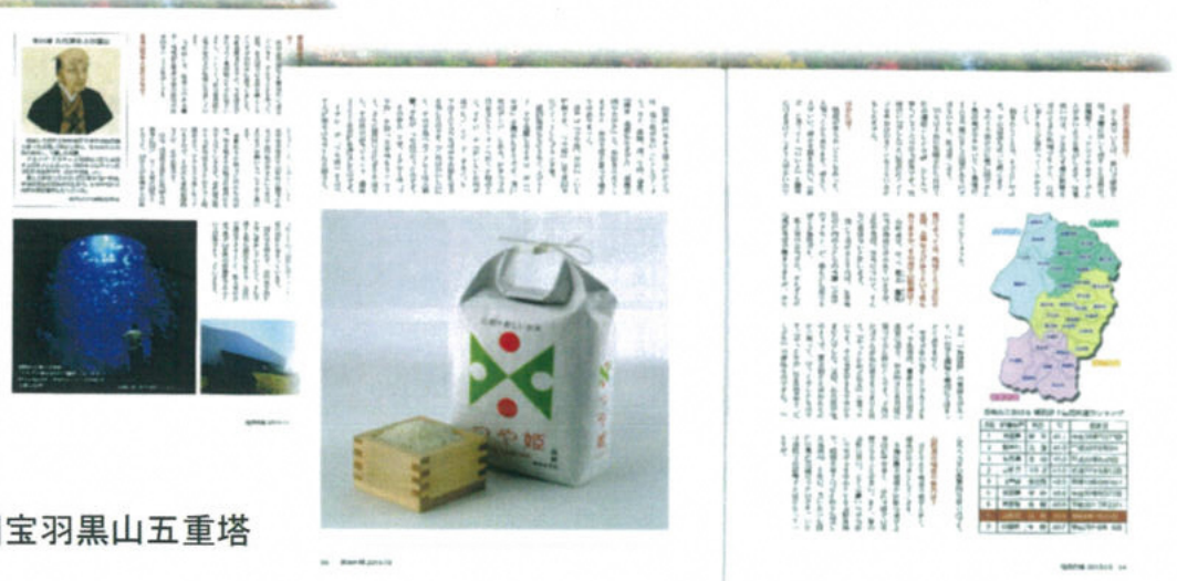
イチローも褒めた「つや姫」、山形のブランド米是非、食べて見て下さい。