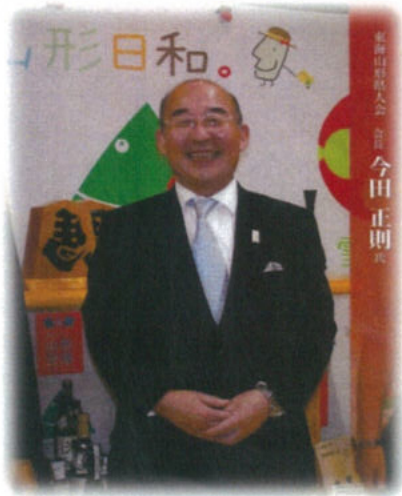
会長の満面の笑み