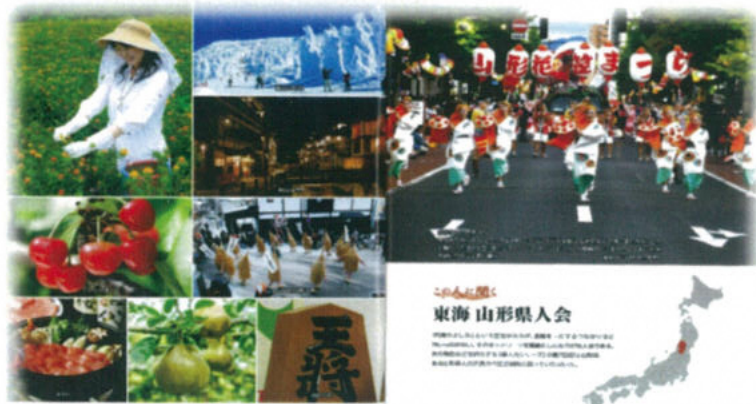
さくらんぼ・蔵王他も沢山紹介して頂きました