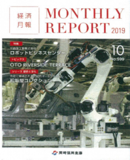
おかしん「経済月報」表紙